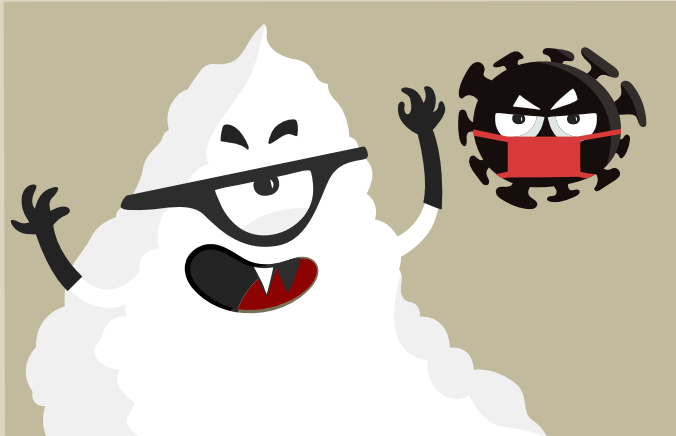
Primeres imatges del terrible Sucrator