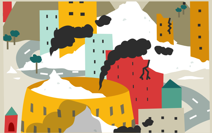
La ciutat de Makedònia sota els efectes de l'epidèmia de Sucrator